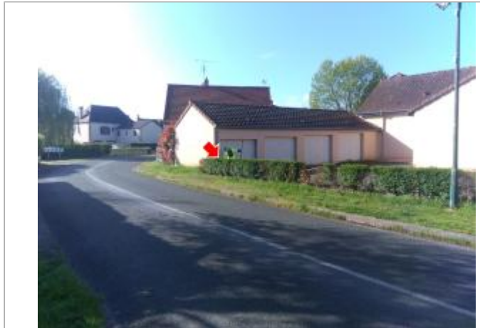
Vue du site en 2024 avec le repère de la crue d'avril 2024

Coordonnées WGS84 : X: 4.02737054 / Y: 46.53423190