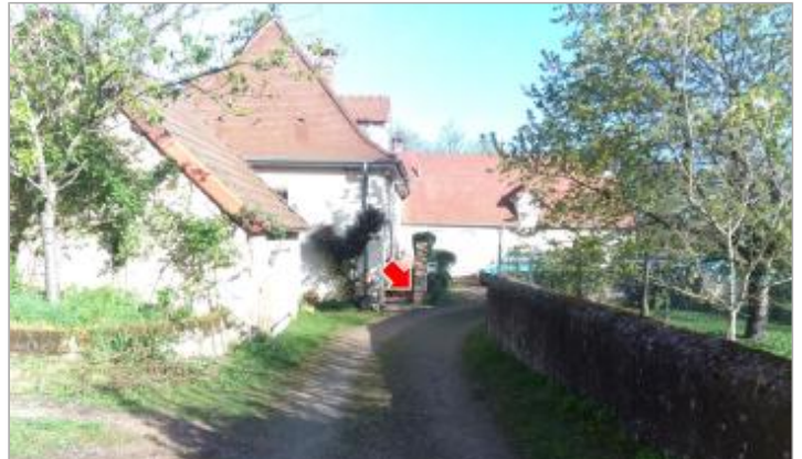
Vue du site en 2024 avec le repère de la crue d'avril 2024

Coordonnées WGS84 : X: 4.02850340 / Y: 46.53390980