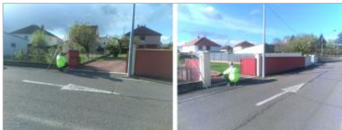
Vue du site en 2024 avec le repère de la crue d'avril 2024