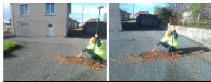
Vues du repère en 2024

GÉNÉRAL Code : 24LACIAX2_R_188_1 Date de mise à jour : 06/03/2025 Auteur : SPC LACI