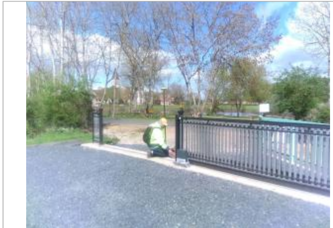
Vue du site en 2024 avec le repère de la crue d'avril 2024

Coordonnées WGS84 : X: 4.06452522 / Y: 46.62568280