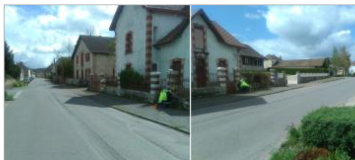
Vues du site en 2024 avec le repère de la crue d'avril 2024

GÉOLOCALISATION Coordonnées WGS84 : X: 4.13170512 / Y: 46.69663870 Coordonnées RGF93 (Lambert 93) X: 786474.23 / Y: 6622457.93 Coordonnées RGF93 (ETRS89) : X: 4.1317051 / Y: 46.6966387 Code Hydro: K1--0180 Rive de référence: Gauche