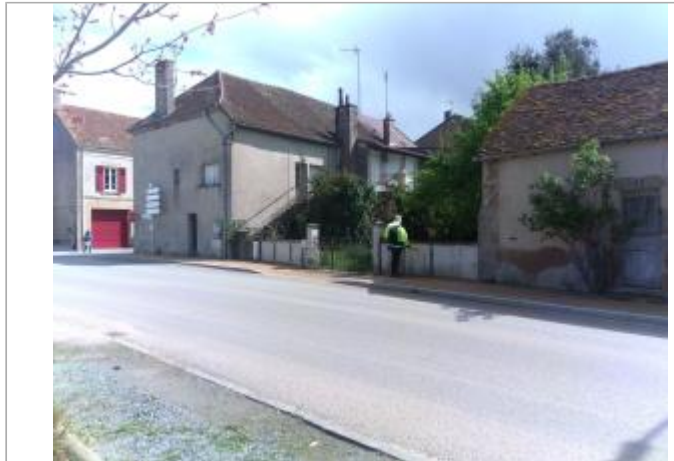
Vue du site en 2024 avec le repère de la crue d'avril 2024

Coordonnées WGS84 : X: 4.13407648 / Y: 46.69519260