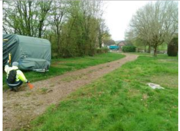
Vue du site en 2024 avec le repère de la crue d'avril 2024

Coordonnées WGS84 : X: 4.13563375 / Y: 46.80440030