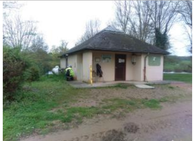
Vue du site en 2024 avec le repère de la crue d'avril 2024

Coordonnées WGS84 : X: 4.13363790 / Y: 46.80350210