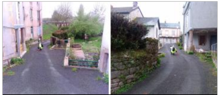
Vue du site en 2024 avec le repère de la crue d'avril 2024

Coordonnées WGS84 : X: 4.18503321 / Y: 46.86647030