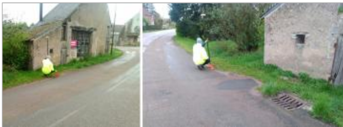
Vues du repère en 2024