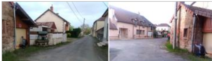
Vues du site en 2024 avec le repère de la crue d'avril 2024