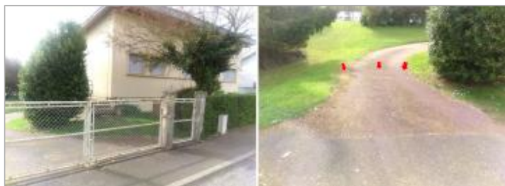
Vue du site du repère d'avril 2024 depuis la rue, en 2024