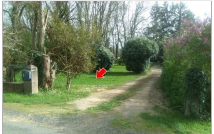
Vue du site en 2024 avec le repère de la crue d'avril 2024

Coordonnées WGS84 : X: 4.19663148 / Y: 46.90692660