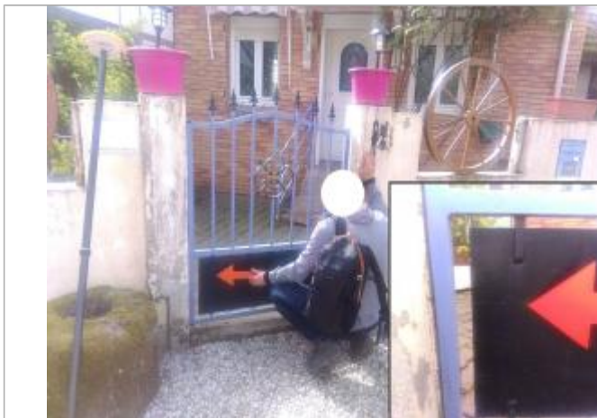
Vue du repère en 2024

Altitude calculée de l'eau (en m) : 279.144 m