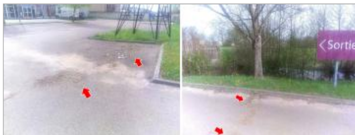
Vues du repère en 2024