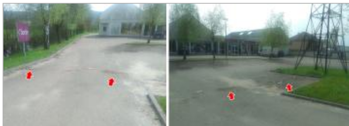
Vues du site en 2024 avec le repère de la crue d'avril 2024

Coordonnées WGS84 : X: 4.28305607 / Y: 46.95687480