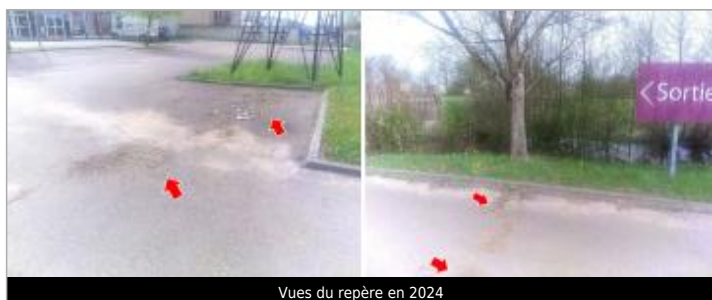
Vues du repère en 2024