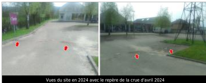
Vues du site en 2024 avec le repère de la crue d'avril 2024