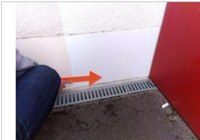
Vue du repère en 2024

Altitude calculée de l'eau (en m) : 290.949 m