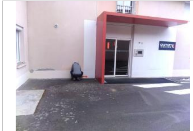
Vue du site en 2024 avec le repère de la crue d'avril 2024

Coordonnées WGS84 : X: 4.29431718 / Y: 46.96699310