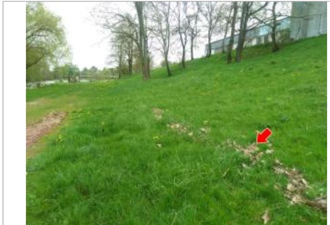
Vue du site en 2024 avec le repère de la crue d'avril 2024

Coordonnées WGS84 : X: 4.28543870 / Y: 46.95442290