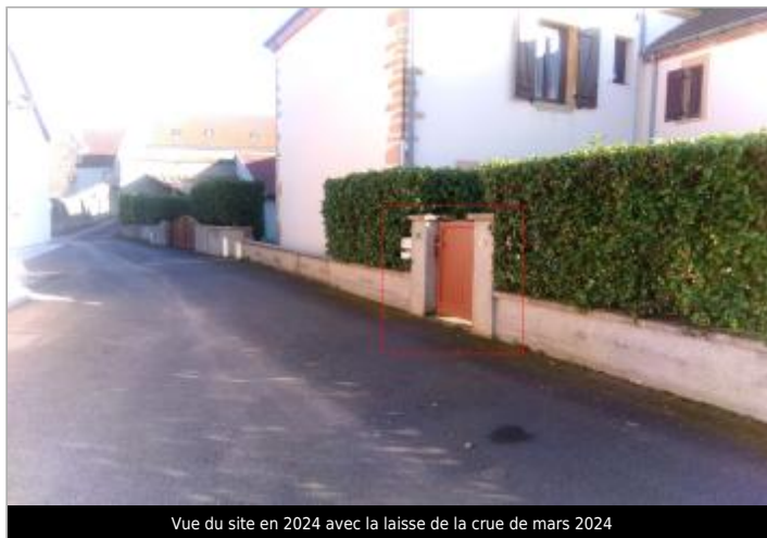
Vue du site en 2024 avec la laisse de la crue de mars 2024