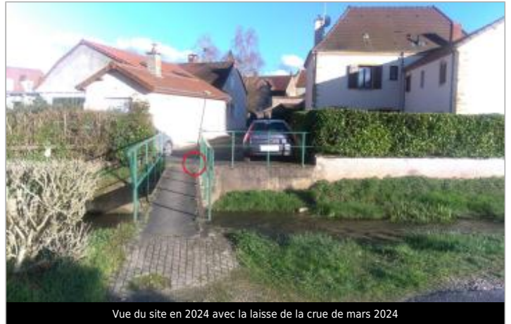
Vue du site en 2024 avec la laisse de la crue de mars 2024