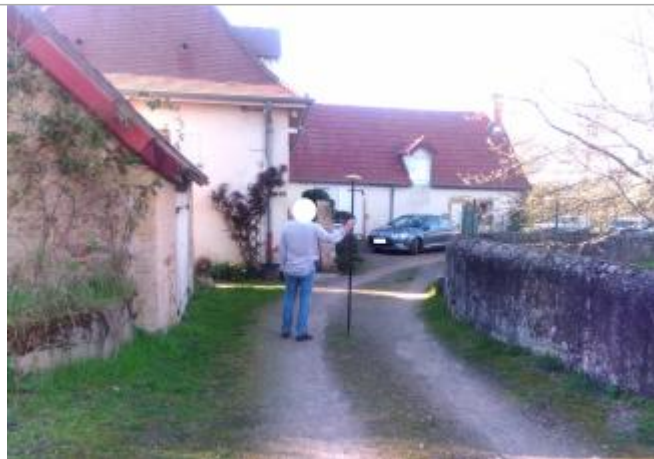
Vue du site en 2024 avec la laisse de la crue de mars 2024