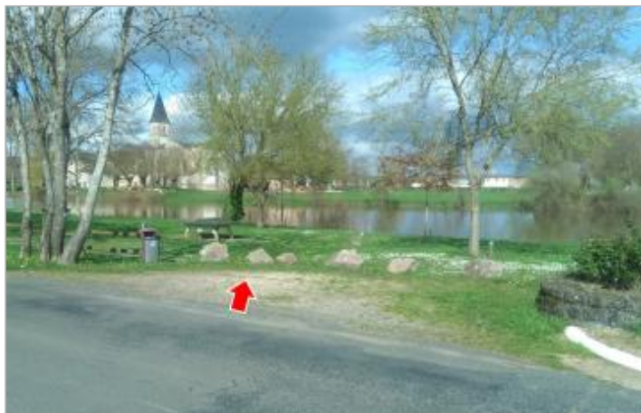
Vue du site en 2024 avec la laisse de la crue de mars 2024