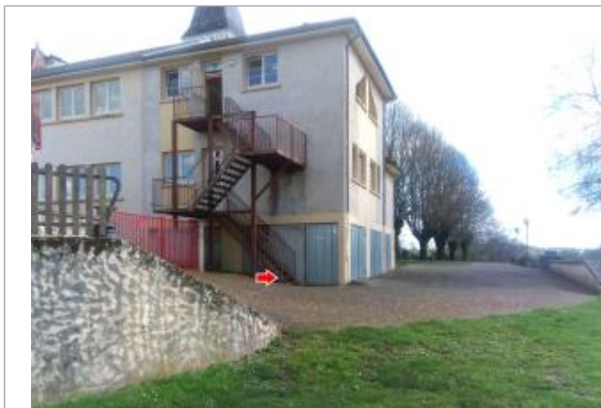
Vue du site en 2024 avec la laisse de la crue de mars 2024