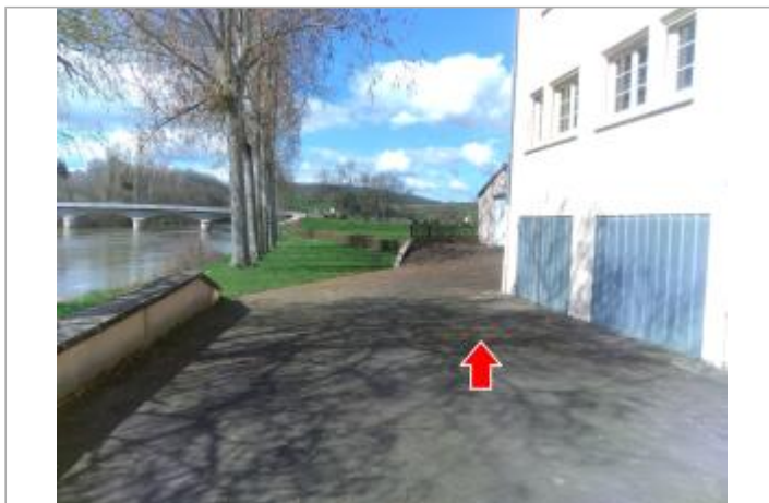
Vue du site en 2024 avec la laisse de la crue de mars 2024