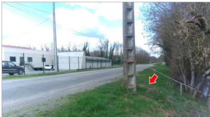
Vue du site en 2024 avec la laisse de la crue de mars 2024