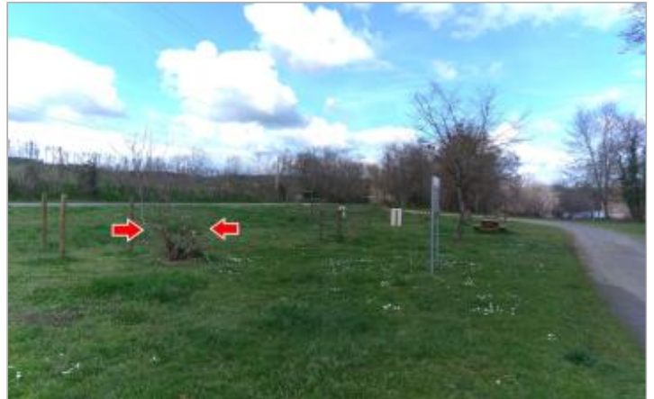
Vue du site en 2024 avec la laisse de la crue de mars 2024

Coordonnées WGS84 : X: 4.13381200 / Y: 46.70427900