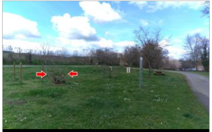
Vue du site en 2024 avec la laisse de la crue de mars 2024

Coordonnées WGS84 : X: 4.13381200 / Y: 46.70427900