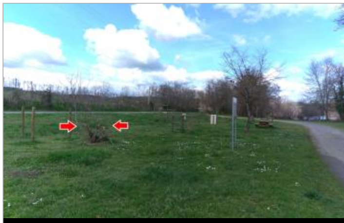
Vue du site en 2024 avec la laisse de la crue de mars 2024