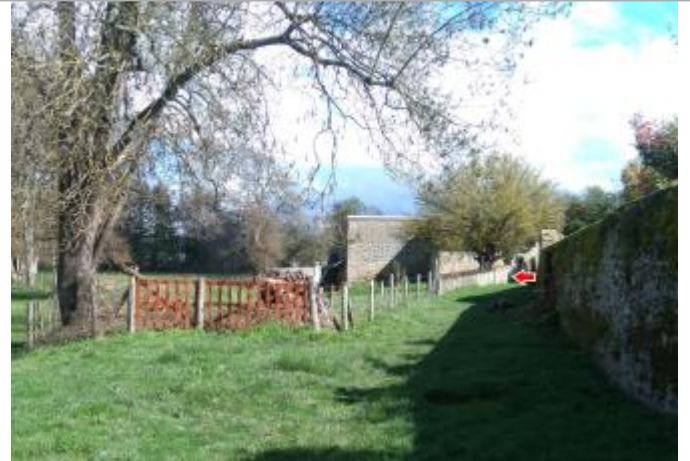
Vue du site en 2024 avec la laisse de la crue de mars 2024