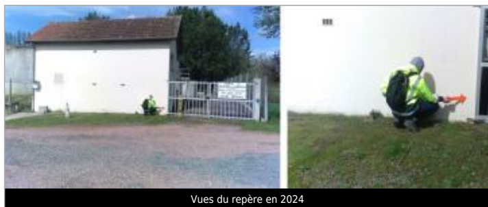
Vues du repère en 2024