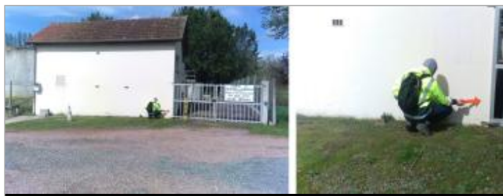
Vues du repère en 2024