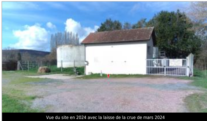
Vue du site en 2024 avec la laisse de la crue de mars 2024