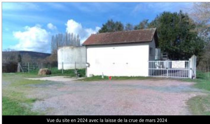
Vue du site en 2024 avec la laisse de la crue de mars 2024