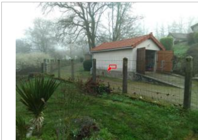
Vue du site en 2024

Coordonnées WGS84 : X: 4.19043900 / Y: 46.87765800