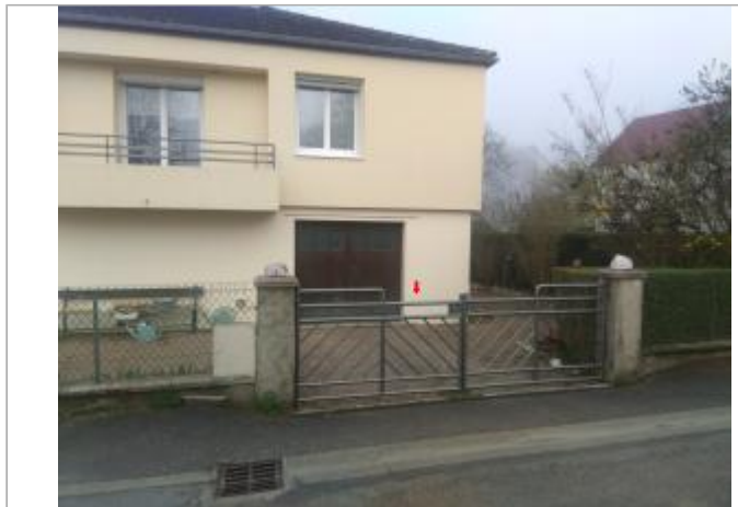
Vue du site en 2024

Coordonnées WGS84 : X: 4.19027300 / Y: 46.87494500