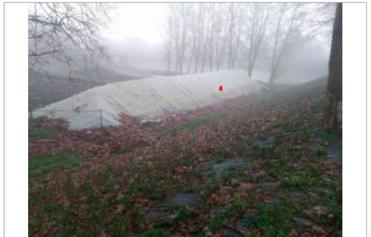
Vue du site en 2024

Coordonnées WGS84 : X: 4.18499700 / Y: 46.86689100