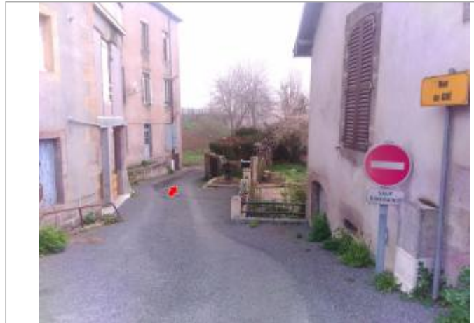
Vue du site en 2024

Coordonnées WGS84 : X: 4.18506400 / Y: 46.86648400