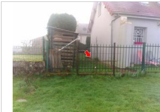
Vue du site en 2024

Coordonnées WGS84 : X: 4.18934600 / Y: 46.87277600