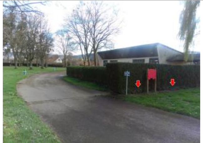
Vue du site en 2024

Coordonnées WGS84 : X: 4.29279200 / Y: 46.96422000