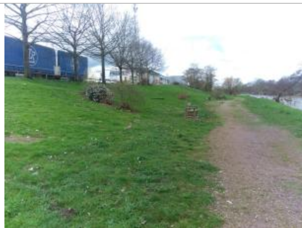
Vue du site en 2024