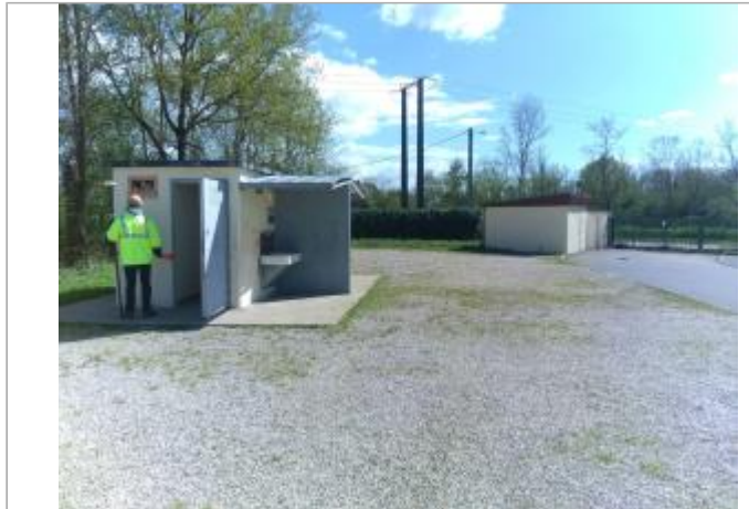
Vue du site en 2024 avec le repère de la crue d'avril 2024