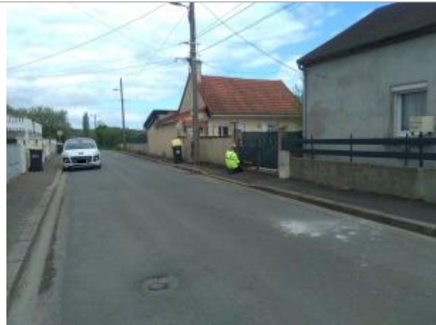
Vue du site en 2024 avec le repère de la crue d'avril 2024

Coordonnées WGS84 : X: 3.98882960 / Y: 46.49201000