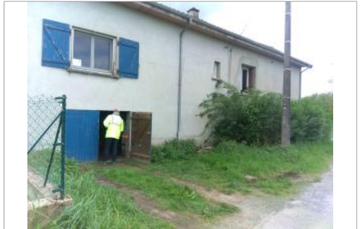
Vue du site en 2024 avec le repère de la crue d'avril 2024

Coordonnées WGS84 : X: 3.98452794 / Y: 46.49275430