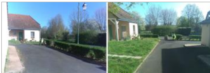
Vues du site en 2024 avec le repère de la crue d'avril 2024