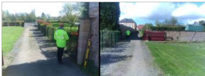
Vues du site en 2024 avec le repère de la crue d'avril 2024