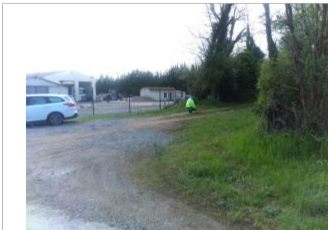
Vue du site en 2024 avec le repère de la crue d'avril 2024

Coordonnées WGS84 : X: 4.13351768 / Y: 46.70296040