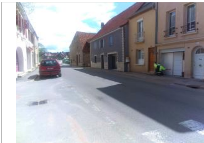
Vue du site en 2024 avec le repère de la crue d'avril 2024

Coordonnées WGS84 : X: 4.13458613 / Y: 46.69517370