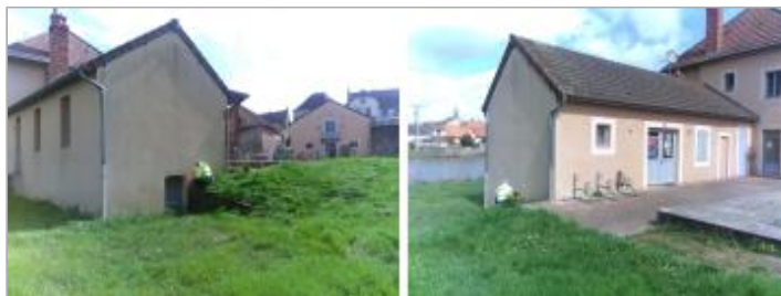
Vues du site en 2024 avec le repère de la crue d'avril 2024