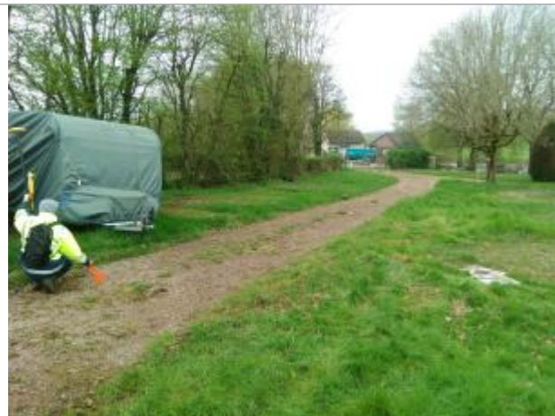
Vue du site en 2024 avec le repère de la crue d'avril 2024

Coordonnées WGS84 : X: 4.13563375 / Y: 46.80440030