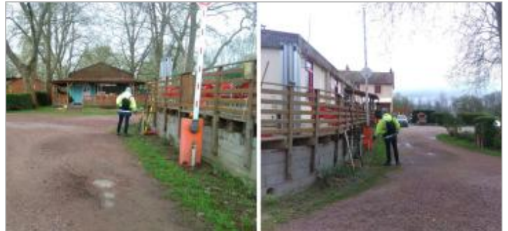
Vues du site en 2024 avec le repère de la crue d'avril 2024