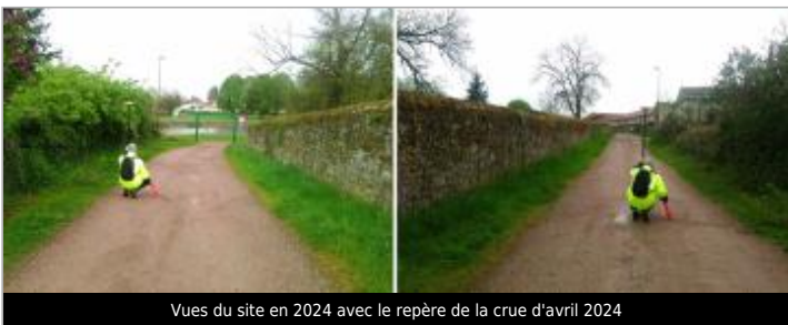
Vues du site en 2024 avec le repère de la crue d'avril 2024

GÉOLOCALISATION Coordonnées WGS84 : X: 4.18704833 / Y: 46.86489770 Coordonnées RGF93 (Lambert 93) X: 790421.81 / Y: 6641205.13 Coordonnées RGF93 (ETRS89) : X: 4.1870483 / Y: 46.8648977 Code Hydro: K1--0180 Rive de référence: Gauche