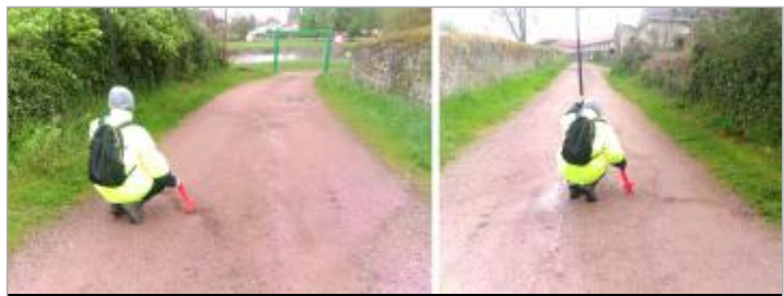
Vues du repère en 2024

GÉNÉRAL Code : 24LACIAX2_R_132_1 Date de mise à jour : 06/03/2025 Auteur : SPC LACI