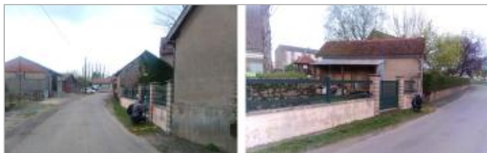
Vues du site en 2024 avec le repère de la crue d'avril 2024