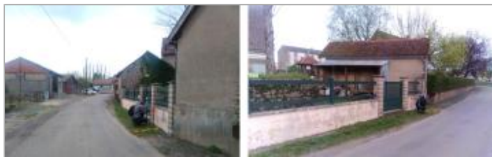
Vues du site en 2024 avec le repère de la crue d'avril 2024