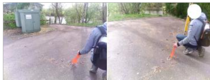
Vues du repère en 2024

GÉNÉRAL Code : 24LACIAX2_R_121_1 Date de mise à jour : 06/03/2025 Auteur : SPC LACI