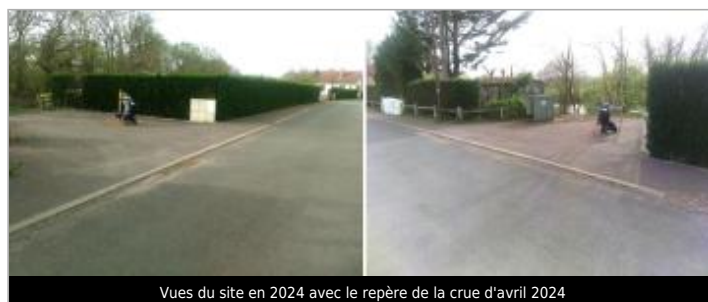
Vues du site en 2024 avec le repère de la crue d'avril 2024

GÉOLOCALISATION Coordonnées WGS84 : X: 4.18967632 / Y: 46.87380290 Coordonnées RGF93 (Lambert 93) X: 790607.08 / Y: 6642197.09 Coordonnées RGF93 (ETRS89) : X: 4.1896763 / Y: 46.8738029 Code Hydro: K1--0180 Rive de référence: Droite